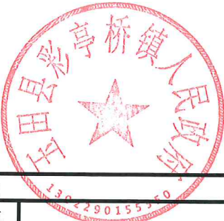
项目支出绩效自评表 (2023年度)