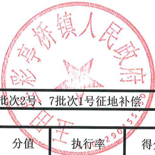
项目支出绩效自评表 (2023年度)