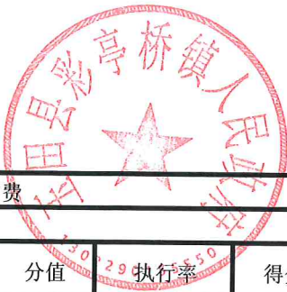
项目支出绩效自评表 (2023年度)