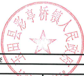
项目支出绩效自评表 (2023年度)