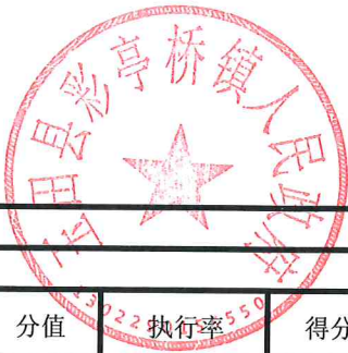
项目支出绩效自评表 (2023年度)