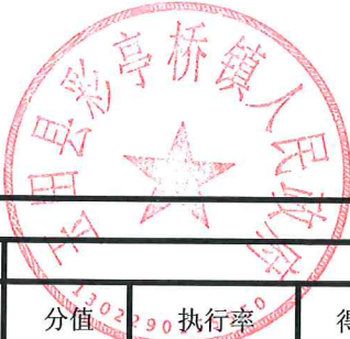
项目支出绩效自评表 (2023年度)