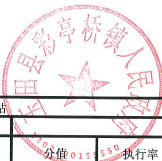
项目支出绩效自评表 (2023年度)