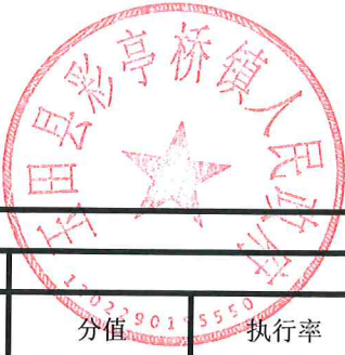
项目支出绩效自评表 (2023年度)