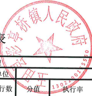
项目支出绩效自评表 (2023年度)