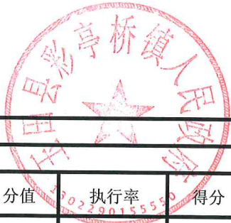
项目支出绩效自评表 (2023年度)