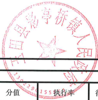
项目支出绩效自评表 (2023年度)