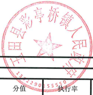
项目支出绩效自评表 (2023年度)