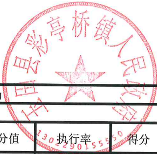
项目支出绩效自评表 (2023年度)