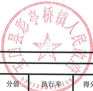
项目支出绩效自评表 (2023年度)