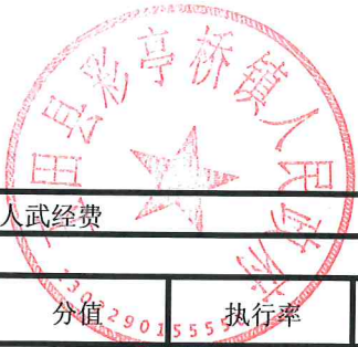
项目支出绩效自评表 (2023年度)