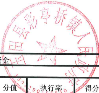
项目支出绩效自评表 (2023年度)