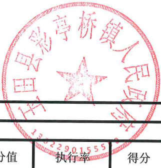
项目支出绩效自评表 (2023年度)