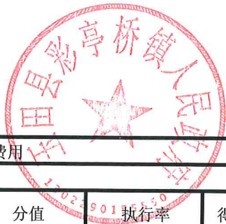
项目支出绩效自评表 (2023年度)