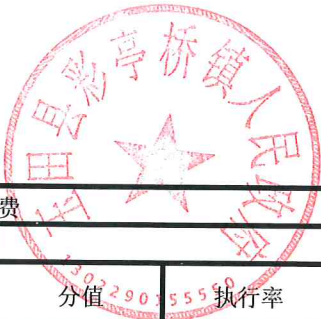
项目支出绩效自评表 (2023年度)