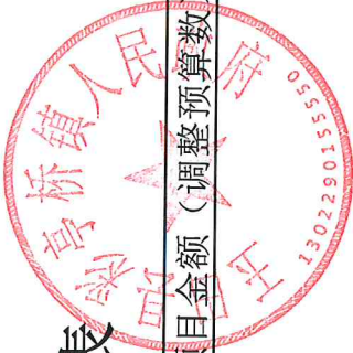
重点项目自评统计表