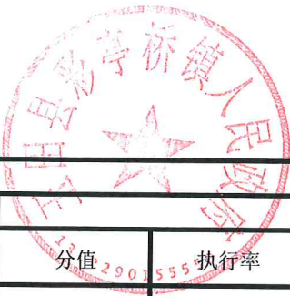
项目支出绩效自评表 (2023年度)